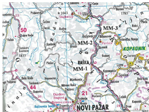
Slika 1. Analizirani deo sliva reke Ibar, od Raške do Kraljeva, sa prikazanim mernim mestima

Analizirani deo sliva reke Ibar prikazana je na slici 1. Ispitivanja su vršena u okviru istraživačkog projekta kojeg je finansiralo Ministarstvo poljoprivrede, šumarstva i vodoprivrede R. Srbije, Republička direkcija za vode.