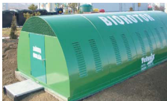
Slika 2. Izgled anaerobnog biodiska

Prednosti RBC sistema su niski energetske zahtevi, kratko vreme zadržavanja, odlična kontrola procesa, mali operativni troškovi i mogućnost rada sa širim spektrima protoka. Nedostaci su nedovoljna fleksibilnost pri variranju opterećenja i radnih uslova [4] kao i česta održavanja na ležajevima vratila i mehaničkim disk jedinicama [20].