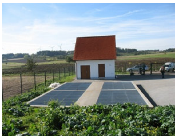
Slika 4. SBR postrojenje srednjeg kapaciteta

Konvencionalni SBR sistemi, uopšteno se sastoje od serije koraka punjenja, reakcije, taloženja, ceđenja i mirovanja u cikličnom radu sa kompletnom aeracijom tokom perioda oksidacije organskih materija i nitrifikacije amonijak-nitrata. Nedavno, SBR sistemi su modifikovani podešavanjem koraka u reakcionom ciklusu radi obezbeđivanja anaerobnih i aerobnih faza u određenom broju i redosleda uklanjanja bioloških materija (C, N i P). SBR proces nudi fleksibilnost u lečenju pri promenljivim protocima, manju uposlenost rukovaoca, opciju za anaerobne ili aerobne uslove u istom rezervoaru, kvalitetan kontakt kiseonika sa mikroorganizmima i substratima, manje površine sistema i dobru efikasnost uklanjanja [22]. Ove prednosti opravdavaju nedavno povećanje primene ovih procesa kod industrijskih [23-25] i komunalnih otpadnih voda [26, 27].