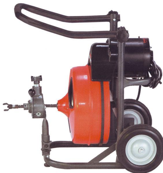
Slika 9. Stroj za čišćenje kanalizacionjskih cijevi sa sajlom i oštricom [40]

Strojevi s oštricom su savitljivi čelični kablovi sa postavljenom oštricom ili svrdlom na vrhu kabla koje na taj način odstranjuje korijenje (slika 9) [16, 18, 39].