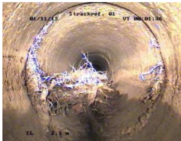
Slika 1. Korijenje koje je prodrlo kroz spoj dvije cijevi [22]

razine podzemne vode nemaju problema s prodorom korijenja [20]. Štete koje se pojavljuju na cijevima, zbog djelovanja korijenja, mogu bit različite: mogu oslabiti spojevi između cijevi, promijeniti se nagib cijevi, pojaviti pukotine, itd. Općenito je dosta rijetko da korijenje ošteti dobro postavljenu i održavanu kanalizacijsku cijev [21].