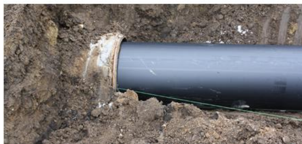
Slika 6. Obnova postojeće cijevi metodom klizajuće obloge [37]

Metoda klizajuće obloge [36] je dobro pozicionirana u suvremenoj praksi. Za vrijeme izvođenja u staru se cijev uvlači klizajuća obloga manjeg promjera (slika 6). Slobodni prstenasti otvor između stare i nove cijevi ispunjava se mortom koji sprječava istjecanje i osigurava konstruktivnu cjelovitost cijevi. U najvećem broju metoda klizajuće obloge, okna se ne mogu koristiti za pristup opremi. U tim situacijama potrebno je iskopati jedan kratki prokop za uvođenje, za svaku dionicu koja se sanira. Zbog navedenog metoda klizajuće obloge nije potpuna tehnologija sanacije bez rova [34, 35].