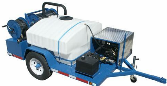
Slika 10. Visokotlačni čistač za čišćenje kanalizacije [41]

te ga je svaki put sve teže ukloniti [18]. Mehanički način uklanjanja koristi se samo za hitno uklanjanje korijenja u slučaju začepljenja cijevi.