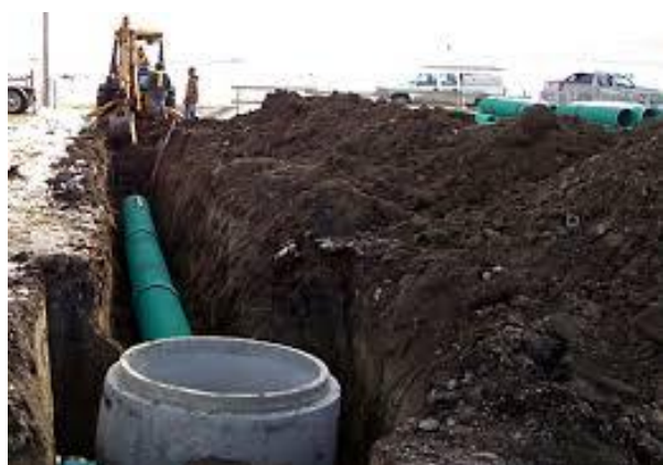
Slika 5. Postavljanje nove cijevi [33]

Drugi način fizičke kontrole je zamjena cijevi (slika 5). Pod zamjenom cijevi smatra se uklanjanje starih, oštećenih cijevi i zamjena novim [18].