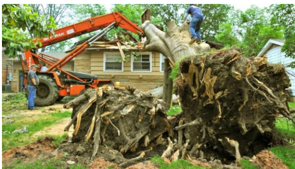
Slika 4. Uklanjanje drveta s korijenom [32]

Prvi način fizičke kontrole je uklanjanje drveća. Ovaj način je najbolji u slučaju nekog drveća s invazivnim korijenjem, npr. vrba. Međutim, često je uklanjanje stabla relativno skupo, a njegovo uklanjanje nije garancija da ćemo se riješiti problema s korijenjem budući da korijenje još može dugo preživjeti bez gornjeg dijela - stabla. Garancija da smo uklonili sve (korijen) može biti jedino vađenje panja (slika 4) što je dosta teško, pogotovo kod većeg drveća [18].