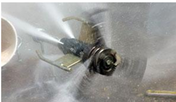
Slika 11. Mlaznica s nastavkom za čišćenje [42]

Kemijski način uklanjanja korijenja je pomoću različitih kemikalija. Kemijske tvari koje uništavaju biljke nazivaju se herbicidi. Kod korištenja herbicida treba obratiti pažnju na to da oni mogu uništiti cijelu biljku ili samo njezin dio na koji je primjenjen herbicid.