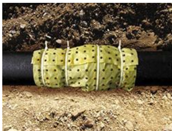
Slika 3. Geotekstil s herbicidom postavljen na spoju dvije cijevi [31]

Ostale barijere koje mogu spriječiti korijenje je dobro zbijeni sloj tla, kemijska zaštita, različite barijere od plastike ili metala [25]. U novije vrijeme pojavljuje se tkanina (geotekstil) koja ima granule koje polagano otpuštaju herbicid (slika 3) i prsten za brtvljenje (brtva) koji sadrži herbicide koje uništavaju korijen [30].