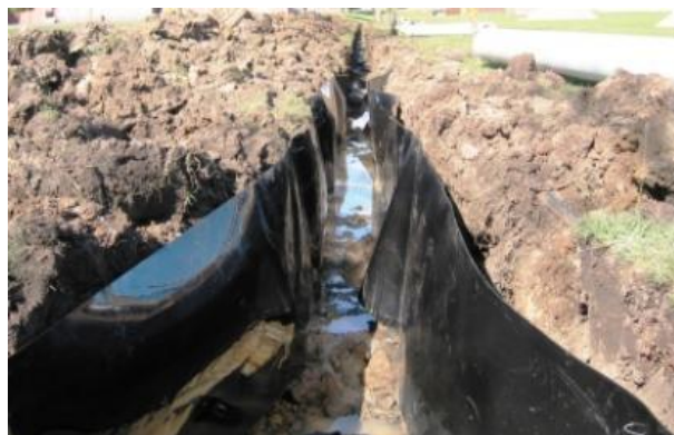
Slika 2. Barijera postavljena u rov cijevi [29]

Također, postoje i različite barijere za korijenje u obliku geotekstila ili geomembrane (slika 2), međutim to je dosta skupo rješenje i teško ga je postaviti kada su cijevi već postavljene [25].