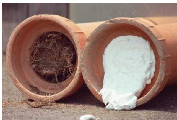
Slika 12. Cijev puna korijenja i pjena u cijevi [43]

Kemijski način uklanjanja korijenja je pomoću različitih kemikalija. Kemijske tvari koje uništavaju biljke nazivaju se herbicidi. Kod korištenja herbicida treba obratiti pažnju na to da oni mogu uništiti cijelu biljku ili samo njezin dio na koji je primjenjen herbicid.