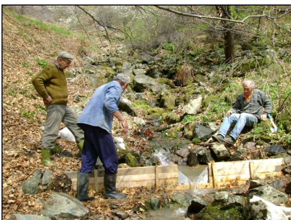
Izrada jedne od brojnih mernih stanica

najpouzdanijih vodovodnih sistema Srbije. Vrlo umešno proširuje kapacitet postojećeg izvorišta u aluvionu Grezanske reke, uključiv i veštačko prihranjivanje, čime efikasno stabilizuje kapacitet tog izvorišta na ne manje od 40 L/s. Međutim, kao čovek koji uvek gleda niz godina unapred, odmah se posvećuje traganju za novim, pouzdanim izvorištem. Kao odličan poznavalac hidroloških i hidrogeoloških prilika, jer je on sva izvorišta na području opštine pasionirano lično hidrometrijski izučavao, usmerio je grad na novo izvorište - "Sinji Vir" u koritu Svrliškog Timoka, oko 2 km uzvodno od Podvisa.