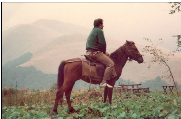
U obilasku najdaljih kutaka Stare planine