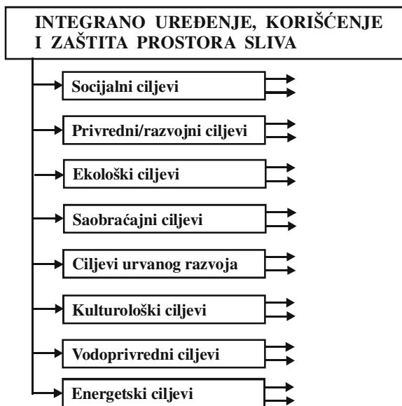
Slika 1: Okvirna šema gornje dela ciljne strukture integralnog razvojnog projekta

Za uspeh projekta je ključno - posebno, sveobuhvatno, mudro i jasno definisati ciljnu strukturu planiranog sistema. Namerno je upotrebljeno više atributa za ciljnu strukturu i oni ovde podrazumevaju: podrobno - shvatiti da je izrada valjane ciljne strukture apsolutno najvažnija aktivnost planera, od koje odlučujuće zavisi uspeh projekta; sveobuhvatno - da se ciljnom strukturu obuhvate svi korisnici prostora, sa svim njihovim ciljevima koje treba dovesti u logičan sklad u okviru integralnih rešenja; mudro - da se unapred procene neformalne grupe koje će se javiti kao oponentija projektu, te da se na vreme, još tokom formiranja ciljne strukture, za njih nađu ubedljivi projektni odgovori; jasno - ciljna struktura mora da bude eksplicitna, jasna, i sa njom mora da bude upoznata čitava javnost, na samom početku prezentacije projekta. Čak bi se moglo formulisati i pravila za prezentaciju projekta javnosti: ● prezentaciju uvek početi sa prikazom kompletne ciljne strukture, obavezno naslovivši projekat prema razvojnom cilju prvog reda ("Integralno uređenje, korišćenje i zaštita prostora ..."); ● ciljeve u oblasti voda i hidroenergetike u ciljnoj strukturi nikako ne