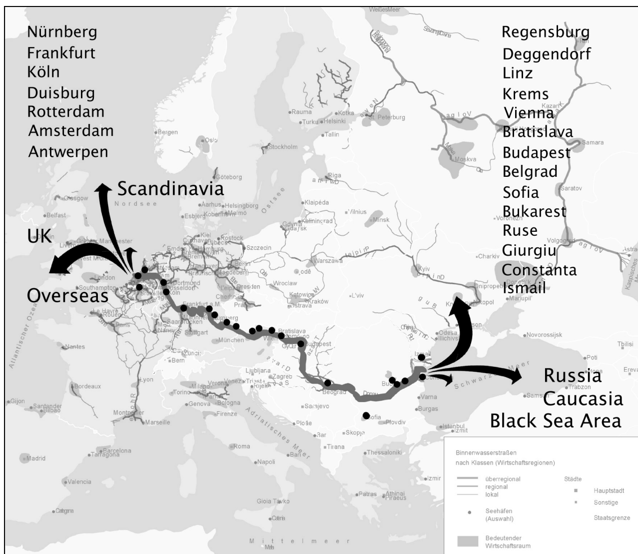
Slika 1. Evropski saobraćajni KORIDOR VII

Utvrđeno je da se ulazak brodova (sastava) u sektor plovnog puta reke Dunav od km 1164 do km 1176 i na područje od km 1150 do km 1154 vrši po Poisson-ovom zakonu raspodele verovatnoća sa srednjim intenzitetom brodova (sastava) \lambda = 1,667 brodova (sastava)/h.