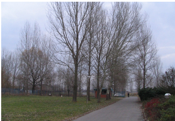
Slika 2. Izgled lokaliteta vodozahvata I subotičkog vodovoda – pogled ispred kontrolno-komandnog centra

potrebnu količinu vode uz održavanje konstantnog pritiska od 2 bara na sabirnom cevovodu. Broj bunara u bunarskom polju je veći od potrebnog tako da ne rade svi istovremeno već se uključuju i isključuju prema potrebi, u zavisnosti od trenutnog nivoa vode u bunaru, broja radnih sati pumpi, ispravnosti pojedinih delova sistema i naravno, trenutnih potreba potrošača.